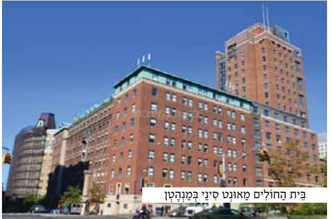
בית החולים מאונט סיני במנהטן