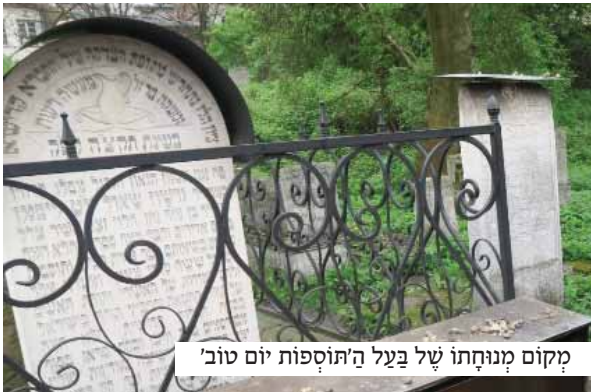
מקום מנוחתו של בעל 'התוספות יום טוב'