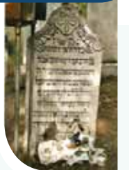
ציון קדשו של הרבי ר' שמעלקא מניקלשבורג זצ"ל

רבי שמואל שמעלקא הלוי הורוויץ נולד בשנת תפ"ו בצ'ורטקוב לאביו רבי צבי הירש שנתמנה באותה שנה לרבה של העיר. בילדותו למד תורה מפי אביו, ועסק בתורה וימים וליילה יחד עם אחיו רבי פינחס בעל ה'הפלאה'. בהמשך נסע יחד עם אחיו להסתופף בצלו של המגיד מסזריטש, והם נמנו על גדולי תלמידיו.