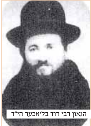
הגאון רבי דוד בליאכער הי"ד

הלוואות וואס דער תלמיד האט גענומען לויט די באפעל פון זיין רבי'ן, און האבן געווארט מען זאל זיי באצאלן.