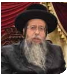
אדמו"ר משבט הלוי וגאב"ד זכרון מאיר שליט"א

און מען קען צולייגן אז נישט נאר דער וואס ענטפערט אמן נאך א 'מי שברך' איז מקיים מיט דעם די מצוה פון "ואהבת לרעך כמוך", נאר אויך דער וואס ענטפערט אמן נאך די ברכות השחר אדער אנדערע ברכות וואס זיי חבר זאגט, אויסער די געהויבענע ענין פון ענטפערן אמן, איז ער אויך מקיים די מצוה פון אהבת ישראל. אזוי ווי דער 'אור זרוע' ('ח"א סי' קס) ברענגט אין נאמען פון ירושלמי, ווען רבי אבא בר זמינא האט אנגעזאגט די בעכער פאר רבי זעירא, האט אים געזאגט רבי זעירא: איך וועל זאגן די ברכה און דין מוציא זיין מיט די ברכה און דו וועסט ענטפערן אמן און אינזין האבן מיך מוציא זיין מיט אמן. ערקלערט דער 'אור זרוע' (שם) דער טעם פארוואס דער מברך דארף יוצא זיין די חוב פון ענטפערן אמן, ווייל די 'אמן' איז א טייל פון