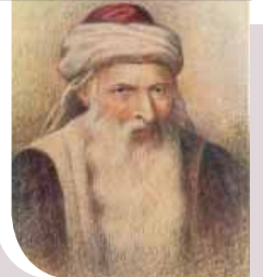
א געשטאלט וואס איז מיוחס צום 'בית יוסף'

רבי יוסף קארו, דער מחבר פון 'בית יוסף' און 'שלחן ערוך', איז געבוירן געווארן אין שפאניע אין יאר רמ"ח צו זיין פאטער רבי אפרים, און עס איז אנגענומען אים צו באצייכענען אלס דער ערשטער פון די תקופה פון די אחרונים. ווען ער איז געווען א קינד, האט זיין פאמיליע געמוזט אימיגרירן צוליב די גירוש שפאניע. נאך די פטירה פון זיין פאטער איז ער אריבער וואוינען אין די הויז פון זיין פעטער רבי יצחק קארו, בעל 'תולדות יצחק', אין קושטא (היינט איסטאנבול).