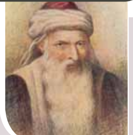
דיוקן המייחס ל'בית יוסף'