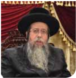
אדמו"ר משיבט הלוי ונאב"ד זכרון מאיר שליט"א