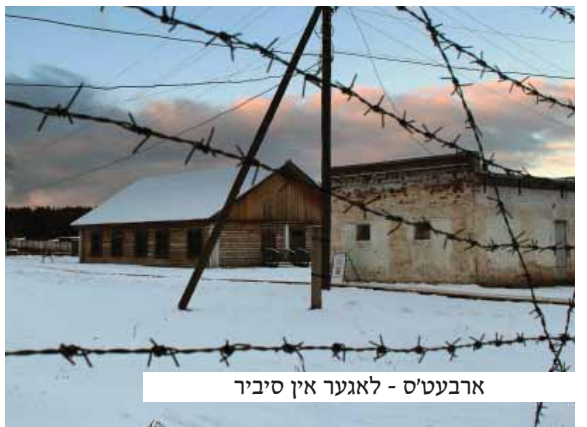
ארבעט'ס - לאגער אין סיביר