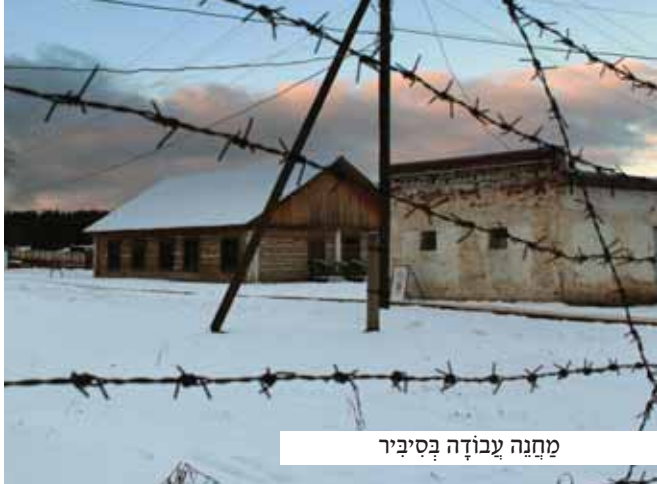
מחנה עבודה בסיביר

הייתי באפיסת כוחות, וכמעט נכנעתי לקול שהדהד בתוכי. כאשר לא הייתי מסגל יותר לסבל, זעקתי בתפלה לה: 'רבוננו של עולם, רחשו שפתי, עזר לי! אינני מסגל יותר להלחם, עשיתי והתאמצתי למען כבוד שמה, וכחותי כבר אוזלים. אָנָּה ה', עזר לי שלא אאלץ לחלל את השבת!'