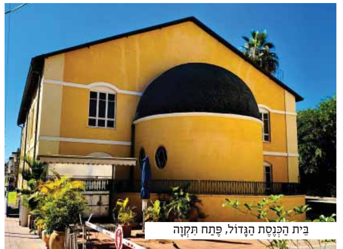
בית הכנסת הגדול, פתח תקוה

ובעודו לוחץ את ידו של אבי ל'מזל טוב', לחש באזניו בתקיפות: 'אבא יקר, לטובתך ולטובת בנה מבקש אני להזהירך, כי אם לא תחזור בך ותוציא באופן מדי את בנה מהגימנסיה, הרי שייכול אתה להיות מבטח כי יחלפו שנות דור עד שהוא יעלה לתורה בשנית'.