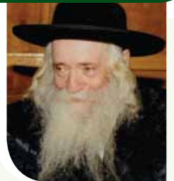
צאנז קלויזענבורגער רבי בעל 'שפע חיים' זצ"ל

אמן און ברכות אין די וועג פונעם בעל הילולא