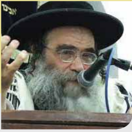
הגה"צ רבי גמליאל רבינוביץ שליט"א מראשי ישיבת שער השמים