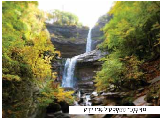
נוף בהרי הקנטסקיל בניו יורק

בנקדה מסימת בכביש, מקום שבו נראו חלונות תאי הכליאה, נעצר האוטובוס. הילדים ירדו, ומידענו המלמד הסביר להם: "יתכן שבאחד התאים שוכנת נשמה יהודית גלמודה הזקוקה לחזק ולעידוד, הבה נצעק לעבר אותה נשמה אלמונית דברי חזק ונאמץ את רוחה..."