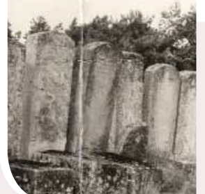
מצבות בבית העלמין היהודי בברודי