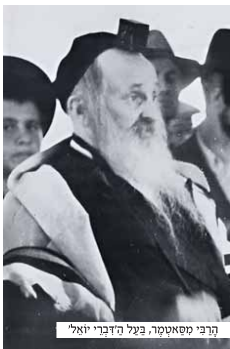
הרבי מסאטמר, בעל הדברי יואל