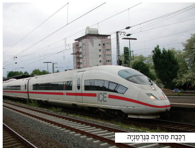
רכבת מהירה בגרמניה

"תנוח דעתך", הרגיע האב המסור את בנו, כשחיוך על שפתיו, "ברוך ה', כלם בריאים ומימים, והעסקים במצב מצוי". "אז למה הגעת עד לכאן?" תהה הבן בחסר הבנה, והאב בתגובה הוציא נרתיק קטיפה מתיקו. "הגעתי לכאן בשביל להביא לך את זה!" אמר והצביע על הטלית שבידיו.