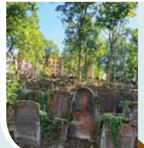
שרידי בית הקברות היהודי בפרנקפורט