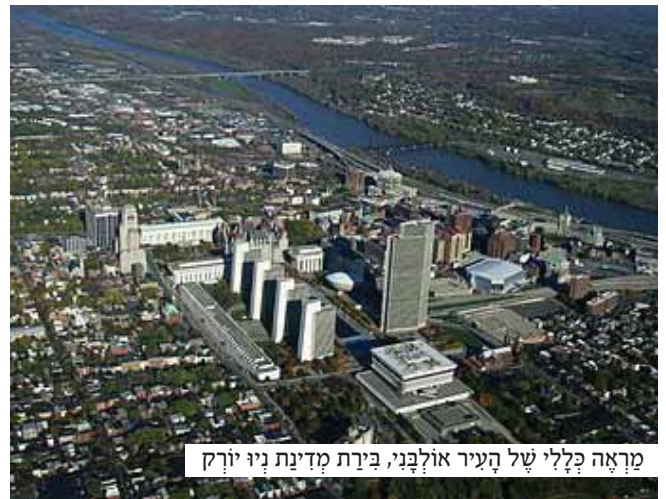
מראה קללי של העיר אולבני, בירת מדינת ניו יורק

שם, בחדר המסך והחמים, עמדה ספה, והשומר הציעה לר' משה תוך כדי שהוא מזהירו כי עם אור ראשון ימהר לעזב את המקום, יען כי ההנהלה בודאי לא תראה בעין יפה את פלישתו למקום, ויתכן אף שהוא יאלץ לשלם על כך באבדן משרתו.