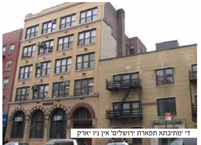
די 'מיתבתא תפארת ירושלים' אין ניו יארק

אבער, טראץ וואס ער איז געווען אזא גוטער דאקטאר האט ער זיך נישט געהאלטן